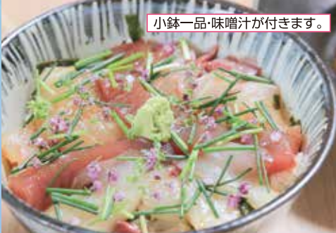
小鉢一品・味噌汁が付きます。

ネギトロサーモン丼 1,380円(税込) サーモンのお刺身単品 980円(税込)