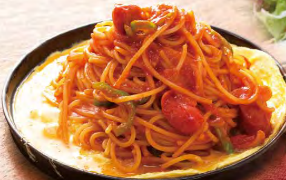
鉄板ナポリタン 900円(税込)