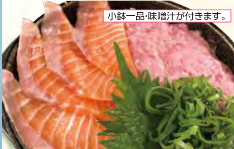
小鉢一品・味噌汁が付きます。

ネギトロサーモン丼 1,380円(税込) サーモンのお刺身単品 980円(税込)