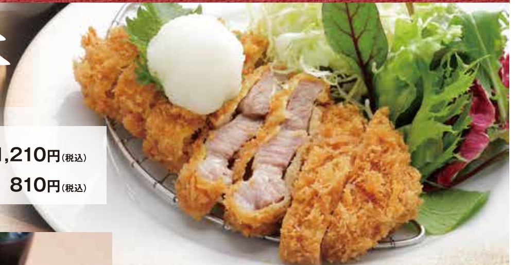
とんかつ単品 810円(税込)