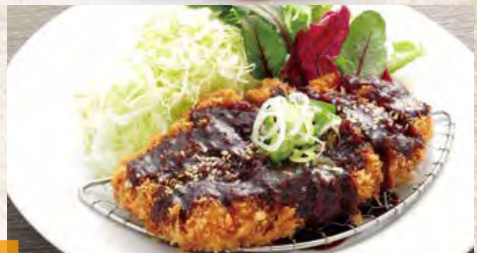
みそかつ定食 1,210円(税込) みそかつ単品 810円(税込)