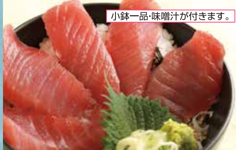
小鉢一品・味噌汁が付きます。