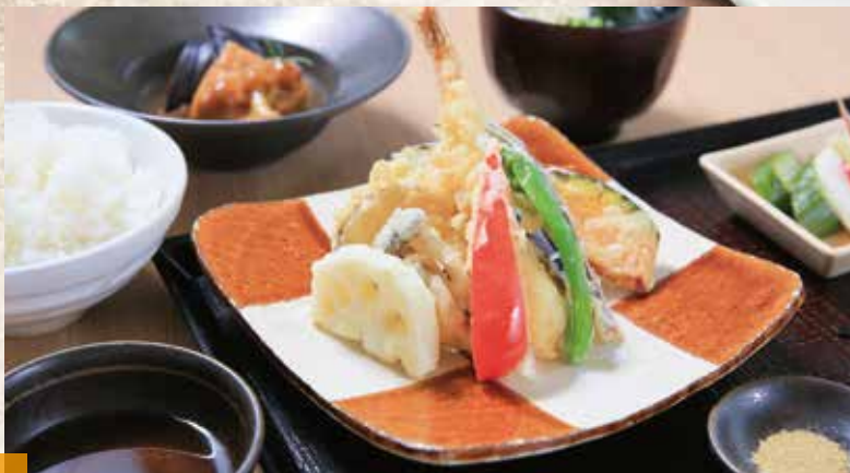
天ぷら定食 1,390円(税込) 天ぷら単品 990円(税込)